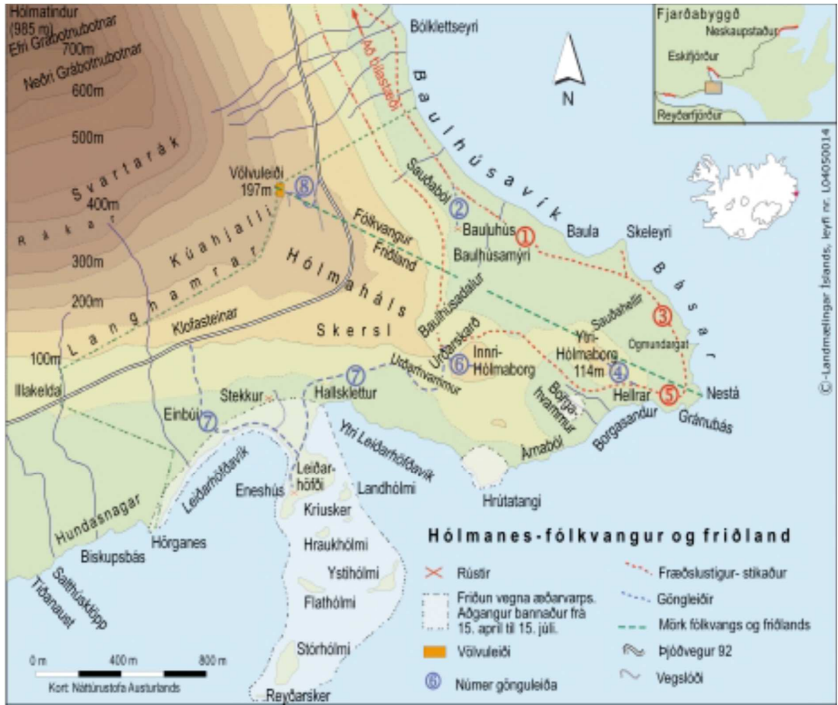
Gönguleiðakort fyrir Hólmanes 14