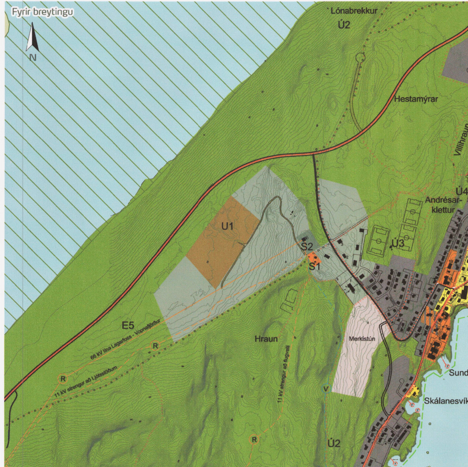
Gildandi aðalskipulag 2006-2026 m.s.br., staðfest af umhverfisráðherra 21.10.2008 mkv. 1:10.000 í A1