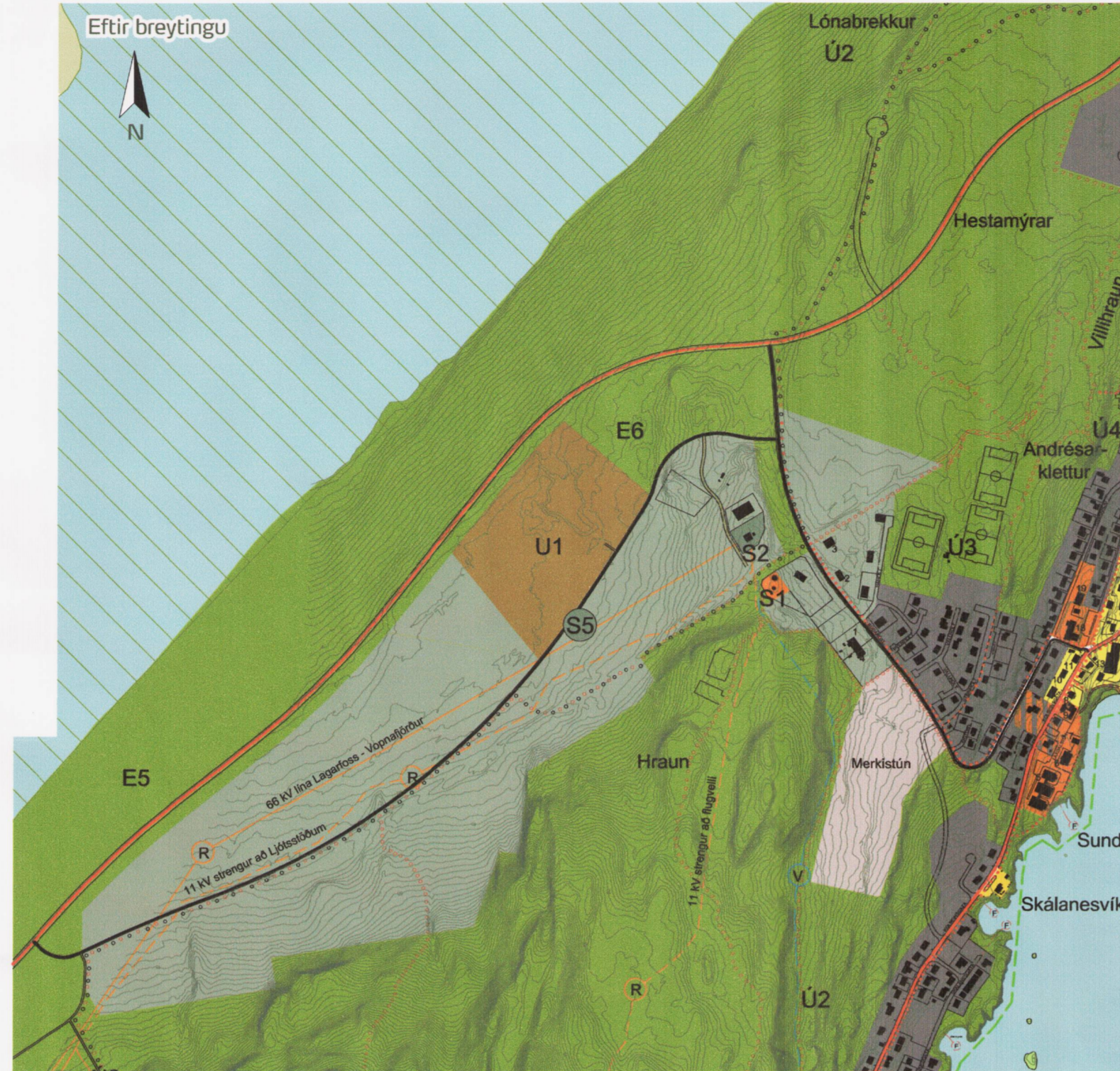
Breytt aðalskipulag mkv. 1:10.000 í A1