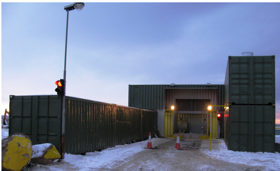
Mynd 1. Aðstaða til að taka á móti lyktarsterkum úrgangi.

Starfsmaður bíður eftir að bíllinn fari nógu langt svo engin hættu stafi af honum og gengur þá í átt að aðstöðunni.