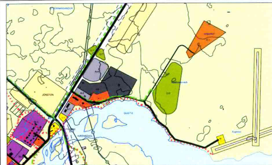
Tillaga að Aðalskipulagi Skaftárhrepps 2010-2022, mkv. 1:10.000

Fráveita, urðunarstaðurinn verður hannaður í samræmi við reglugerð nr. 738/2003 um urðun úrgangs. Einnig verður höfð hliðsjón af reglugerð nr. 737/2003 um meðhöndlun úrgangs.