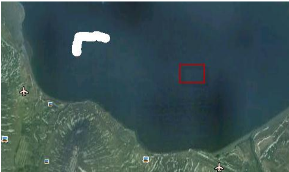
Mynd 4: Hluti af mynd sem Dýrfiskur sendi til skýringar á áhrifasvæði einnar kvísamstæðu við botn. Rauði ferhyrningurinn sýnir reit sem er 300*500 m en það er það svæði sem framkvæmdin þekur við botninn með festingum. Dýrfiskur telur að svigrúm sé til annarar starfsemi í grennd, t.d. kalkþörungavinnslu.

Viðbrögð Dýrfisks við þessu svari eru þau að ljúka starfsleyfisumsókn miðað við upphaflega tilkynnt svæði, sem Skipulagsstofnun úrskurðaði þann 3. júní 2009 að bæri 2.000 tonna eldi af regnbogasilungi og/eða laxi. Umhverfisstofnun vinnur meðfylgjandi tillögu samkvæmt þeirri niðurstöðu. Samkvæmt upplýsingum frá Dýrfiski mun félagið hins vegar hefja vinnu við að afla leyfis fyrir a.m.k. tvö svæði til viðbótar til að geta síðar meir komið af stað þriggja svæða kynslóðaskiptu eldi.