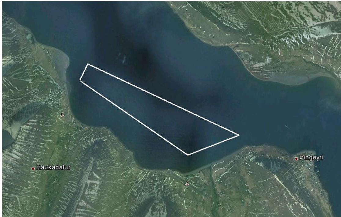
Mynd 2: Í tillögu Umhverfisstofnunar að starfsleyfi er lagt til að eitt eldissvæði verði notað. Þetta svæði er við Haukadalsbót og er það svæði sem upphaflega var tilkynnt til Skipulagsstofnunar.