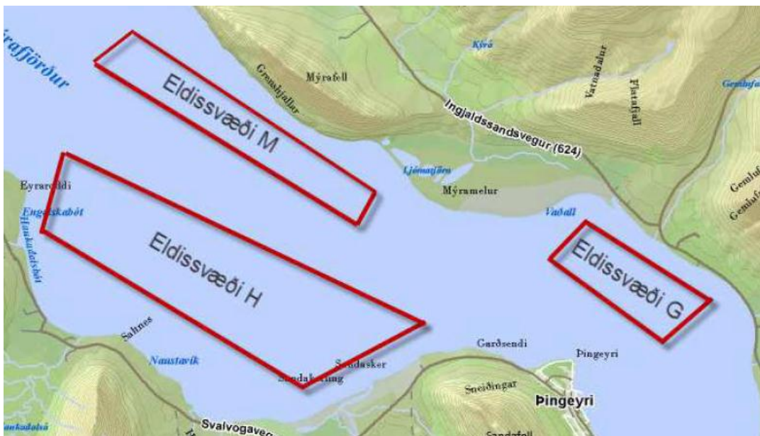
Mynd 1: Eldissvæði Dýrfisks ehf. samkvæmt áformum sem kynnt voru í umsókninni og voru drögum að starfsleyfistillögu sem send var til Heilbrigðisnefndar Vestfjarða og Orkustofnunar. Myndin er fengin úr umsóknargögnunum.

Upphafleg umsókn kom fram um starfsleyfi í maí 2011, en Umhverfisstofnun féllst ekki á að um fullnægjandi umsókn væri að ræða. Bætt var úr flestu því sem vantaði í desember 2011 en þó ekki gerð fullnægjandi grein fyrir notkun gróðurhamlandi efna sem innihalda koparoxíð við varnir gegn ásætum í kvíum. Komið hafði fram að nota ætti slík efni. Upplýsingum um efnanotkunina var bætt við umsóknina í febrúar 2012 og var hún þá samþykkt til afgreiðslu.