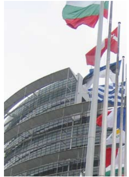
Norden vill påverka EU:s miljöpolitik. EU-parlamentet i Strasbourg.

Genom sina höga ambitioner på miljöområdet kan de nordiska länderna fungera som initiativtagare och drivkraft inte bara inom Norden utan också i Nordens närområden, i EU och internationellt.