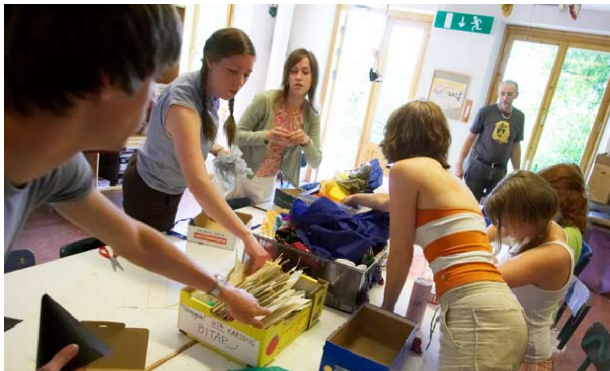
Barn och unga är en viktig målgrupp för nordiskt miljösamarbete.

Resultaten hittills har gällt utveckling av en artdatabank, framtagande av faktaark och inspel till EU:s sjätte forskningsprogram. EU:s miljömyndighet (European Environment Agency) är intresserad av att arbetet ska ingå i deras utveckling av indikatorer för biologisk mångfald.